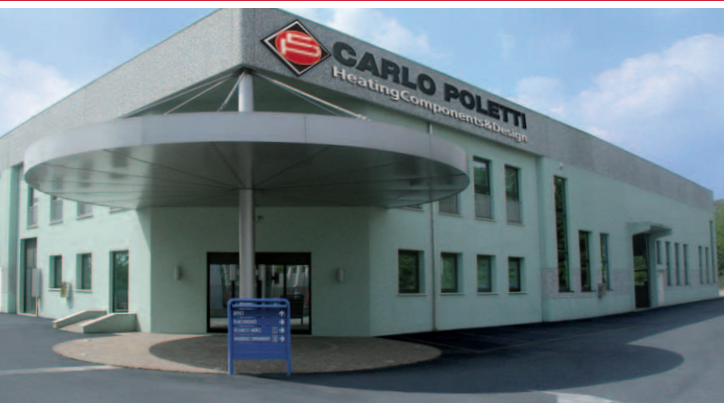
Stabilimento di via Martiri delle Foibe, Gozzano Plant of via Martiri delle Foibe, Gozzano Betrieb in der Via Martiri Foibe, Gozzano