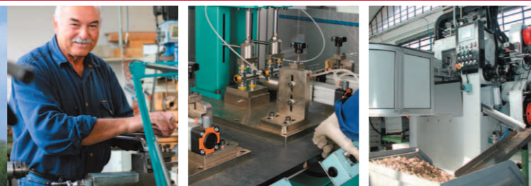
Estabelecimento de Via Martiri delle Foibe, Gozzano Estabelecimento de via Martiri delle Foibe, Gozzano Завод по ул. Martiri delle Foibe, Gozzano