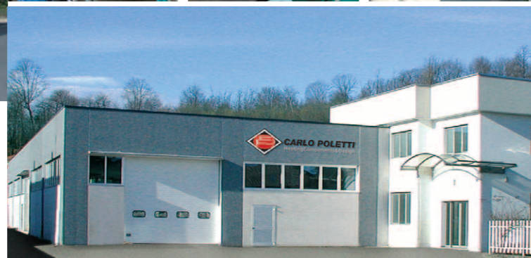
Stabilimento di via Tancognino, Gozzano Plant of via Tancognino, Gozzano Betrieb in der Via Tancognino, Gozzano