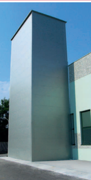
Estabelecimento de via Tancognino, Gozzano Estabelecimento de via Tancognino, Gozzano Завод по ул. Tancognino, Gozzano